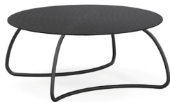
ANTRACITE vern. antracite 44452.02.000