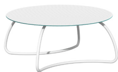
BIANCO vern. bianco 44453.00.000

PT Mesa redonda, Ø172 x 73h cm. Material: tampo em vidro float temperado, impresso e vitrificado a 700°C. Pernas em alumínio pintado. Com pés antiderrapantes.